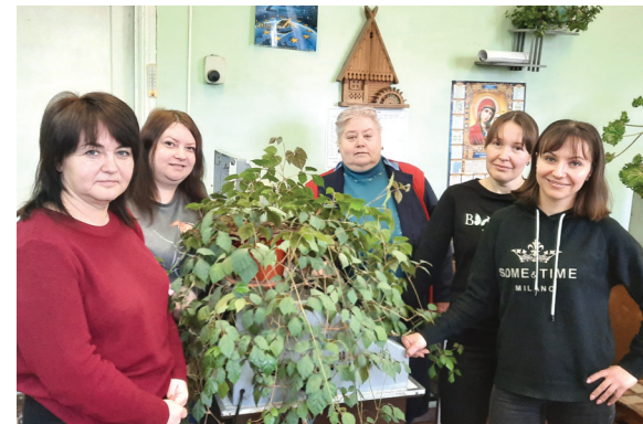
Женский коллектив КИП СЦБ и связи ШЧ Бельцы