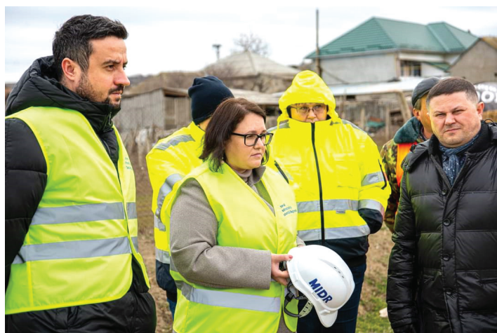
Модернизация участка осуществляется при поддержке ведущих европейских банков

В прошлом году стартовал проект по модернизации стратегически важного южного участка железной дороги Молдовы Бендеры—Каушаны—Басарабяска—Етулия—Джурджулешты. Ремонтные работы в настоящее время ведет компания из Казахстана, выигравшая тендер.