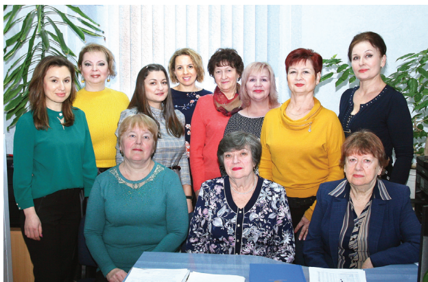
Женский коллектив службы материально-технического обеспечения

Желаю всем здоровья, семейного благополучия, мира и счастья. Пусть сбываются все ваши мечты!