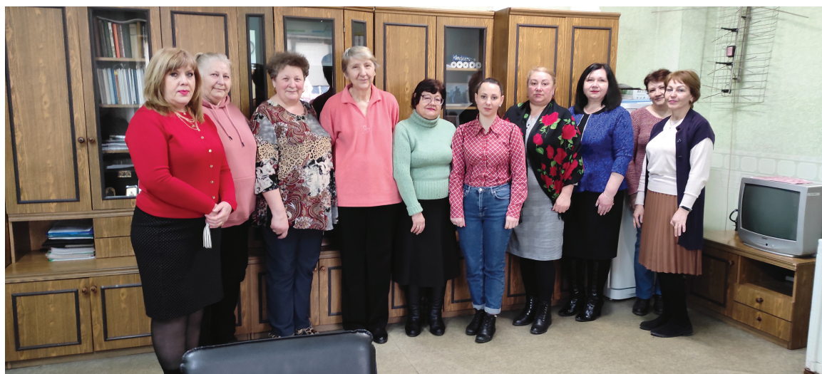
Женский коллектив Бельцкого вагонного депо

Дорогие женщины, крепкого здоровья вам, процветания и достатка. Мы ценим вас всегда такими, какие вы есть, потому что вы — всегда прекрасны.