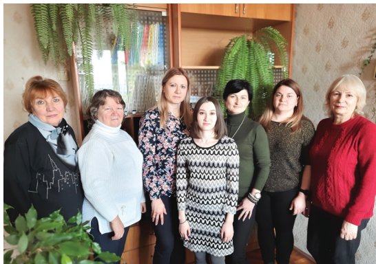
Женский коллектив Бельцкой дистанции сигнализации и связи

Дорогие наши бесценные женщины! Спасибо за жизнь, подаренную нам, за счастье, которое вы несете каждый день, каждый час, за тепло ваших сердец и уют в доме. Благодаря вам, жизнь наполняется яркими красками, а сердце — радостью, любовью и надеждой.