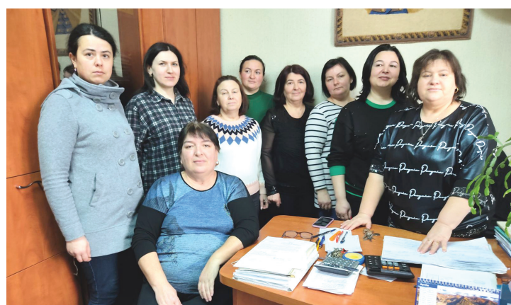
Женский коллектив станции Джурджулешты