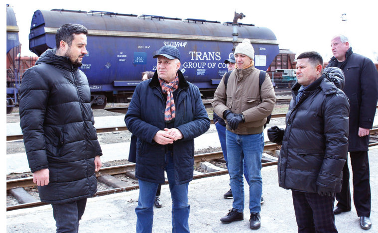
Южный участок обеспечивает транзит грузов из Румынии и Украины