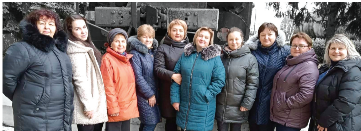
Женский коллектив локомотивного депо Бельцы

проявляют настойчивость в достижении поставленных целей, умение находить нестандартные и эффективные решения самых непростых задач. Позвольте поблагодарить вас, уважаемые женщины, за добросовестный и качественный труд, а также — за заботу о будущем, за неиссякаемую доброту, поддержку и тепло, которое вы дарите окружающим. Желаем вам исполнения самых заветных желаний и успехов во всех начинаниях! Пусть каждый день будет наполнен приятными событиями, вниманием и заботой близких! Счастья, крепкого здоровья и благополучия, уважаемые и дорогие наши коллеги!