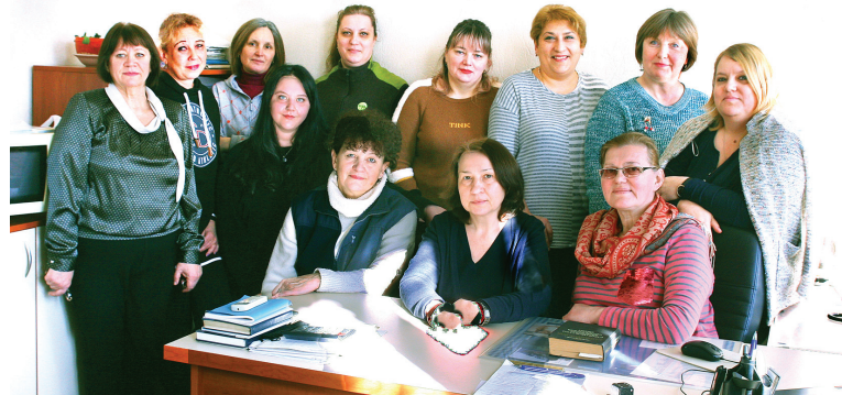
Женский коллектив Кишиневской дистанции сигнализации и связи