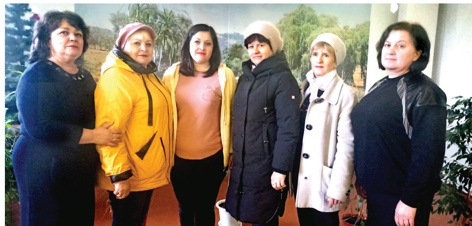
Женский коллектив Бельцкой дистанции пути