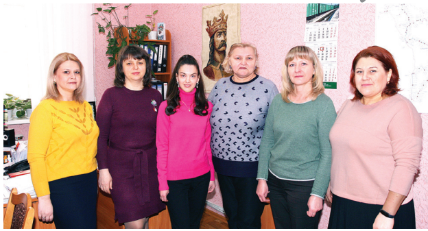
Женский коллектив службы грузовых перевозок

Примите самые искренние и сердечные поздравления с замечательным весенним праздником — 8 Марта! Этот день дает мужчинам редкую возможность не скрывать своих чувств, выразить огромное восхищение и благодарность за то, что вы с достоинством, кропотливо и упорно справляетесь с множеством повседневных задач