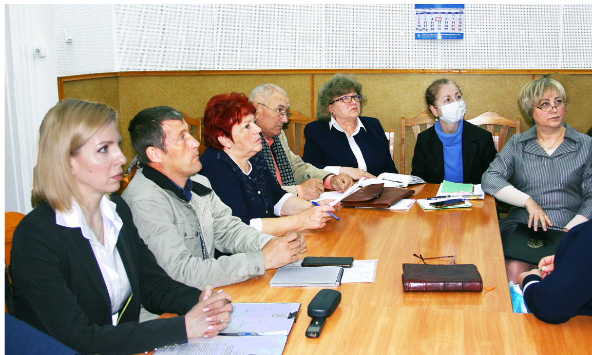
Участники заседания Комиссии по социальному диалогу

— Да, безусловно. Мы стали поднимать вопрос об увеличении заработной платы на Железной дороге Молдовы, в соответствии с принятыми ра-