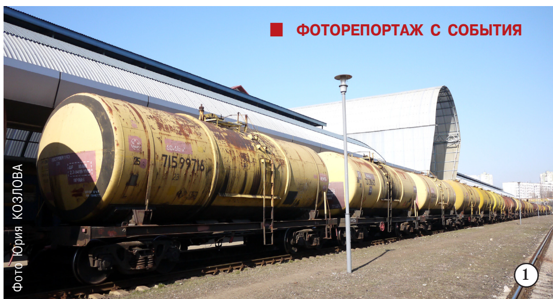
■ ФОТОРЕПОРТАЖ С СОБЫТИЯ

— С особым удовольствием участвую в сегодняшнем меро-