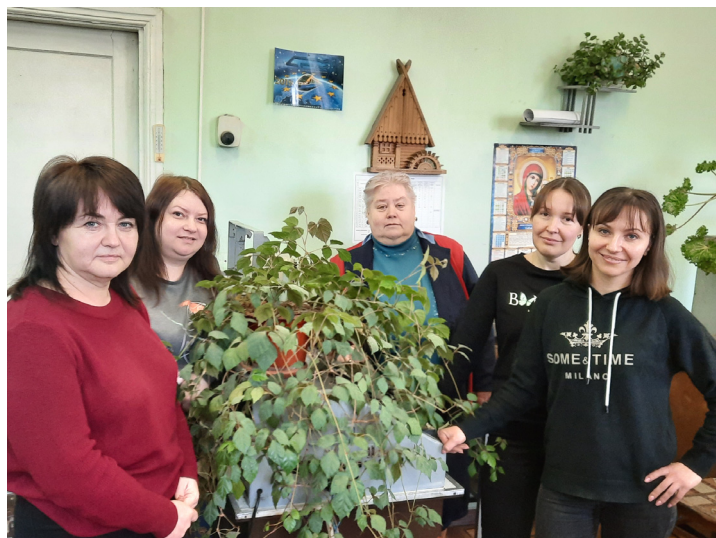
Женский коллектив КИПА СЦБ и связи