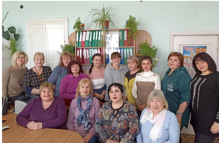
Женский коллектив Басарабьеской дистанции пути