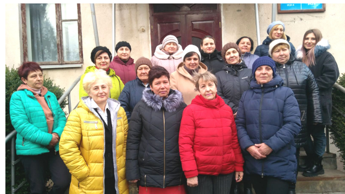
Женский коллектив ВЧД-4