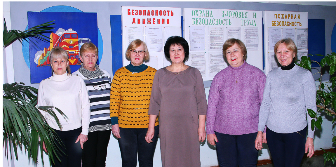
Женский коллектив Кишиневской дистанции электроснабжения

Вы все без исключения — ПРЕКРАСНЫ и самые лучшие!