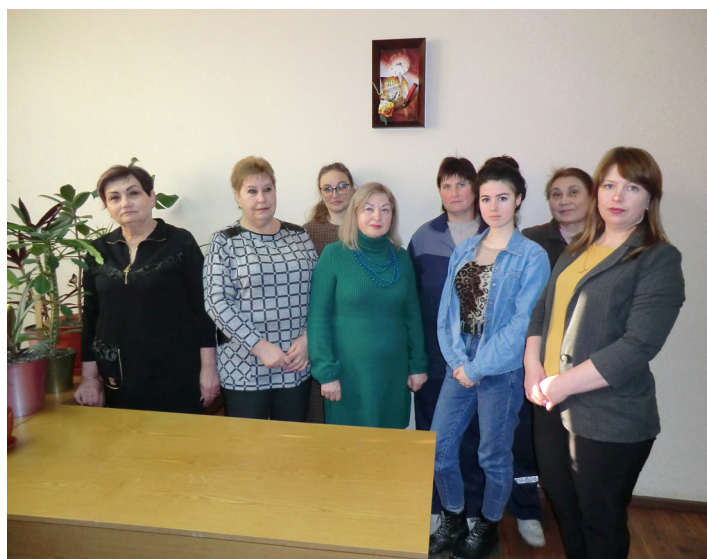
Женский коллектив дистанции электроснабжения Бельцы