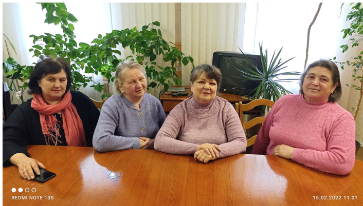
Коллектив дистанции пути Бельцы