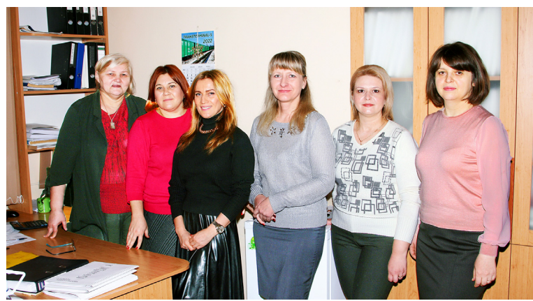
Женский коллектив грузовой службы