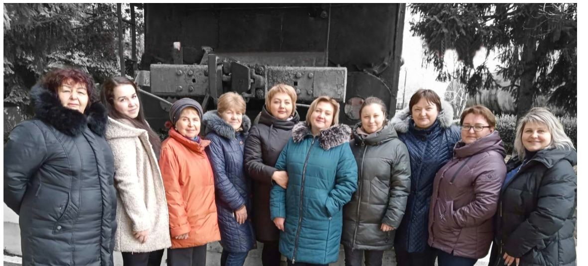
Коллектив локомотивного депо Бельцы