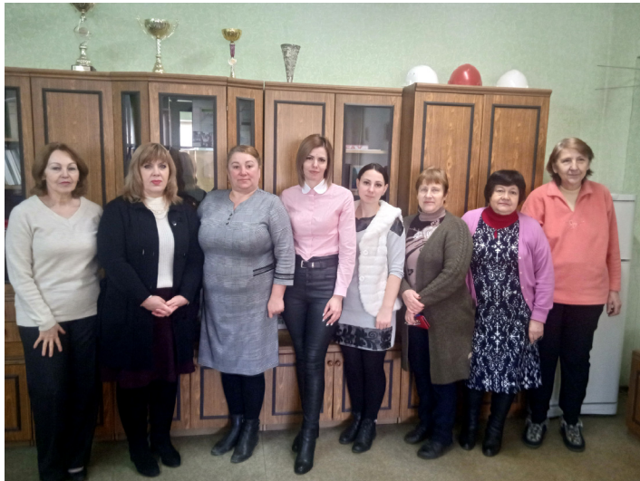
Коллектив вагонного депо Бельцы

Так много хороших, теплых слов, слов уважения и благодарности хочется адресовать вам, наши замечательные женщины, что все, наверное, не вместится в формат газетного поздравления. Поэтому скажу главное: вы сочетаете в себе самые лучшие человеческие качества — красоту, доброту, ум, честность, порядочность, искренность и великодушие. Все, что вы делаете, чего касаются ваши руки, пронизано любовью и добром. В этом, наверное, глубинное предназначение женщины — делать мир прекраснее и совершеннее, привносить в него душевное тепло.