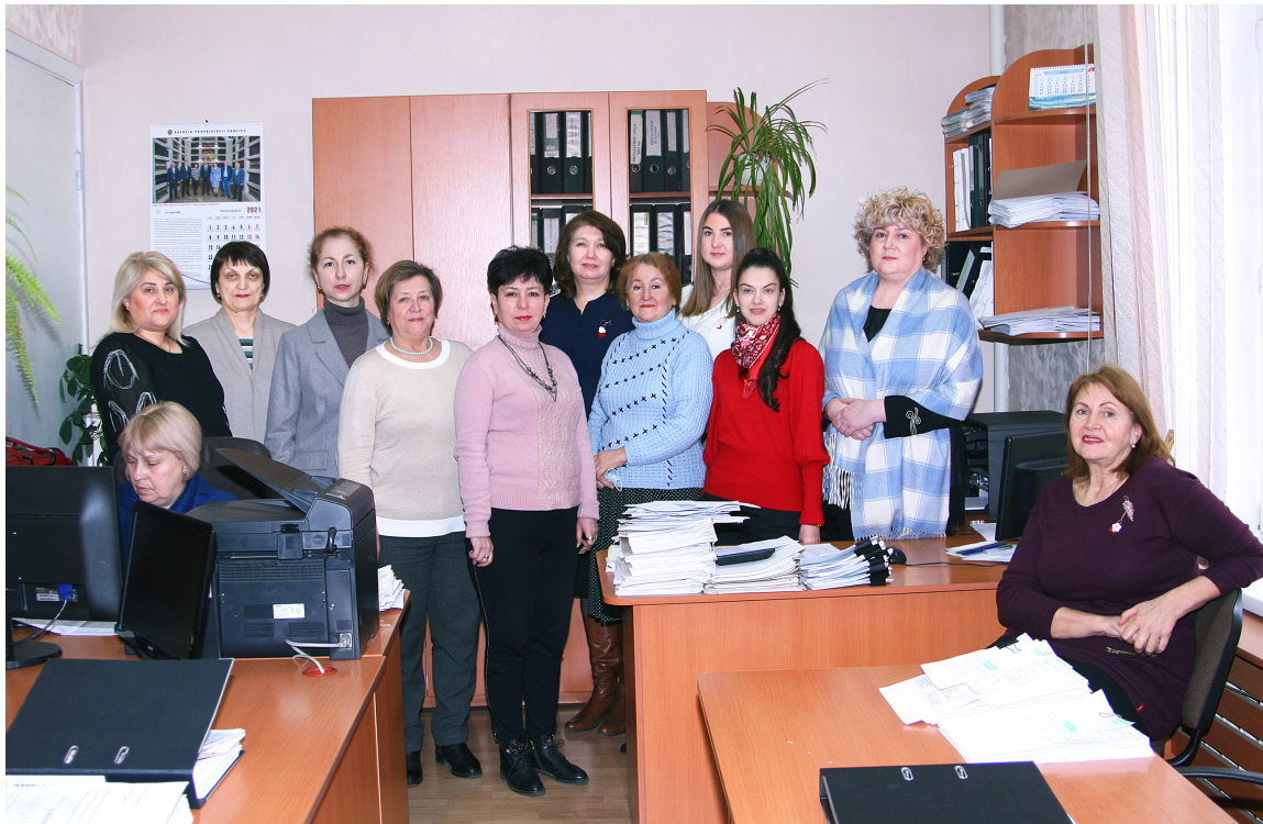
Женский коллектив финансовой и экономической служб CFM

Вы объездили практически все отраслевые подразделения CFM. Нарисуйте, пожалуйста,