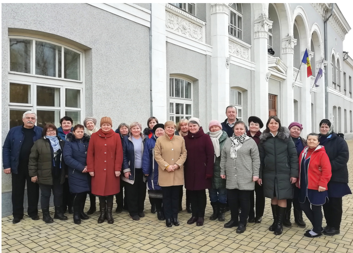
Коллектив станции Унгены