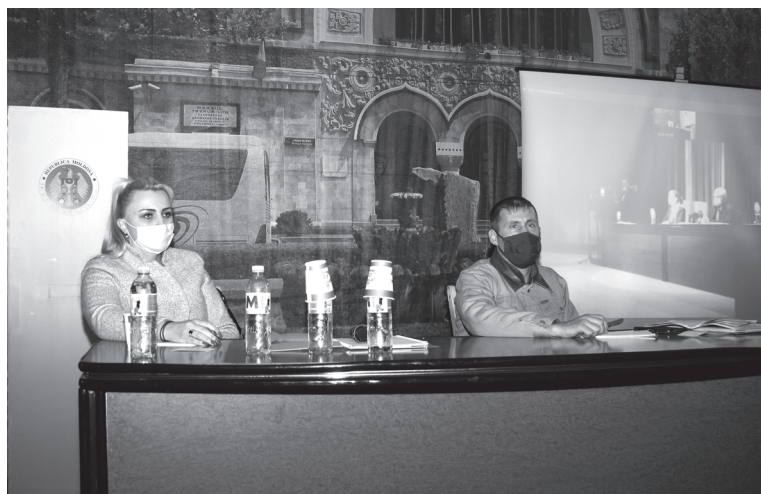
Малый зал Дворца культуры железнодорожников – происходящее в большом зале делегаты съезда видели на установленном экране

из создавшегося положения. Мы – государственное предприятие, и не финансируемся из бюджета. Надо четко понимать, что распоряжаться мы можем только тем, что зарабо-