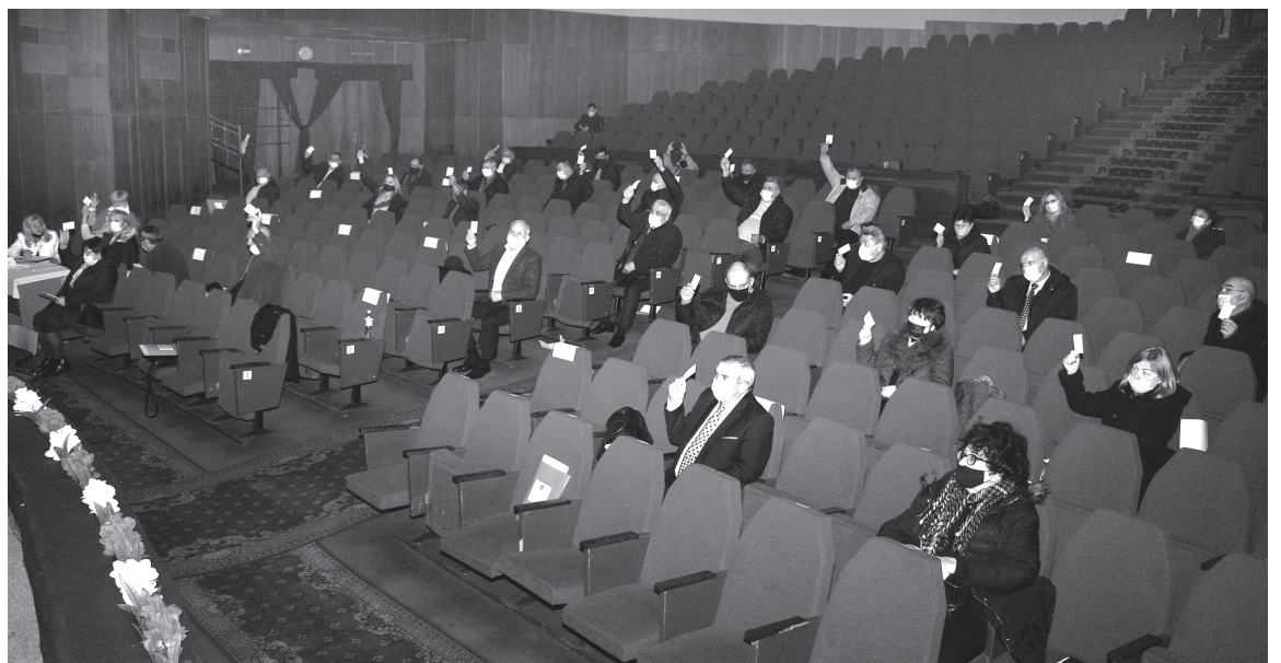
Большинством голосов были приняты все решения на VI съезде Федерации профсоюза железнодорожников Молдовы

Следует отметить, что Национальной кассой социального страхования и Национальной конфедерацией профсоюзов Молдовы при проверках не было установлено нарушений со стороны нашей Федерации.