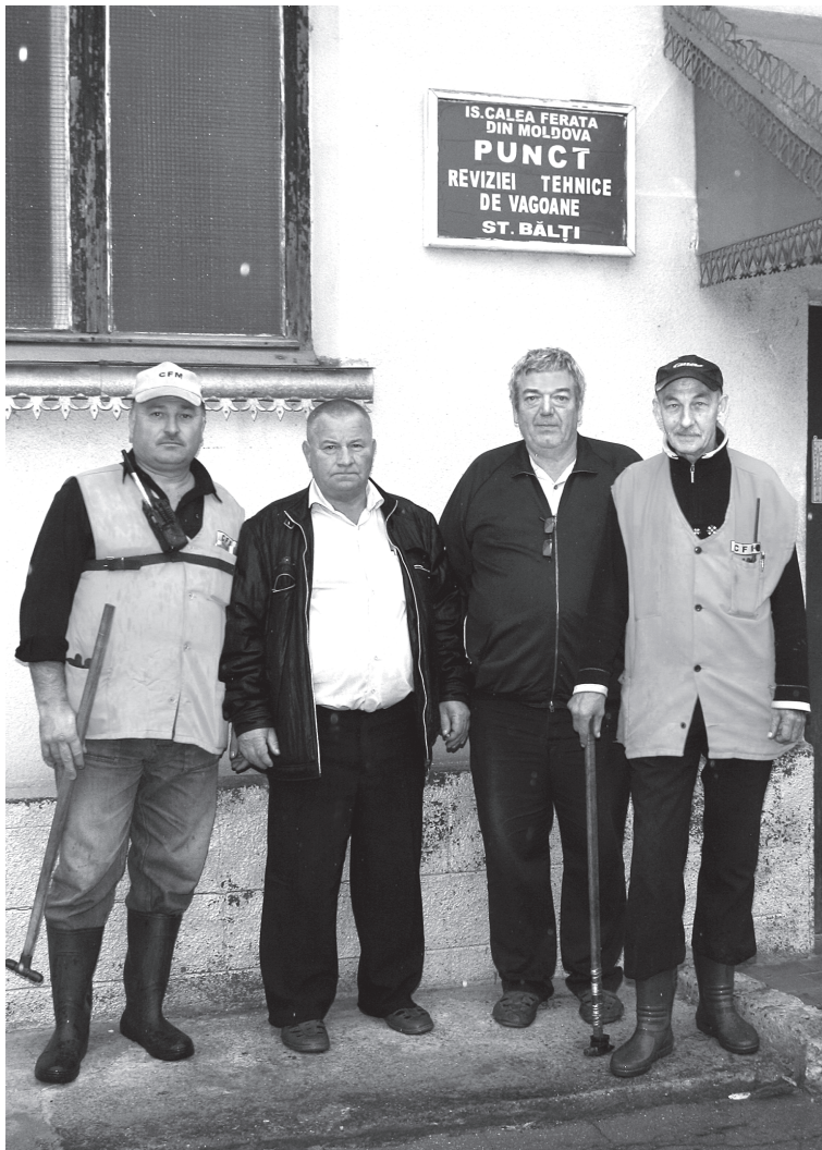
Специалисты Пункта технического осмотра вагонов на станции Бельцы