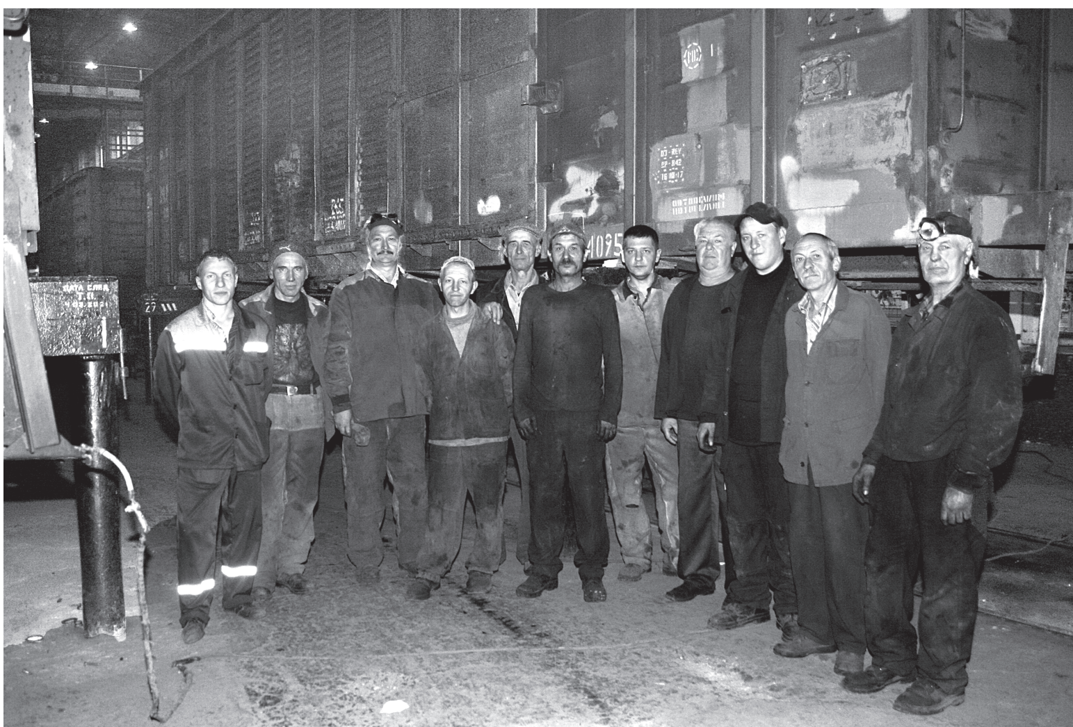
Группа слесарей вагонсборочного цеха