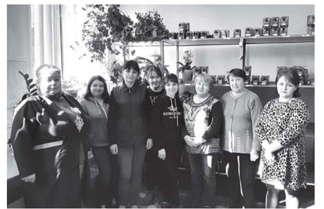
Женский состав Бельцкой дистанции сигнализации и связи — гордость филиала