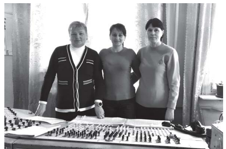
Женский коллектив цеха движения ст.Унгены