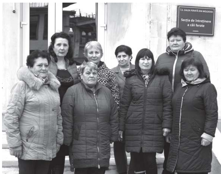
Группа представительниц Кишиневской дистанции пути