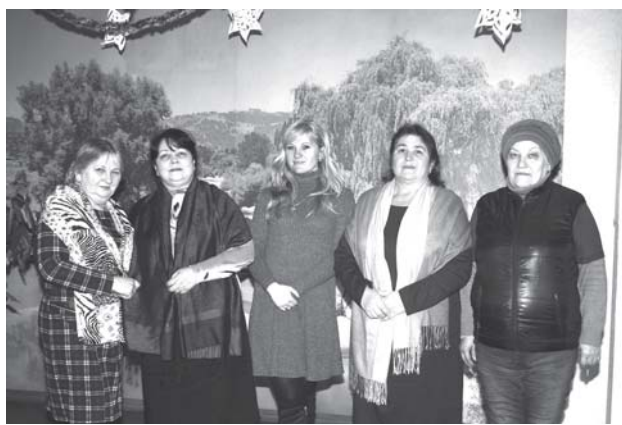
С обязанностями путевого дела прекрасно справляются женщины ПЧ Бельцы