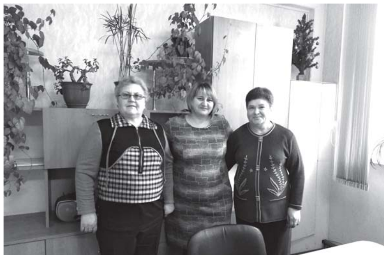
Женский коллектив коммерческого цеха ст.Унгены