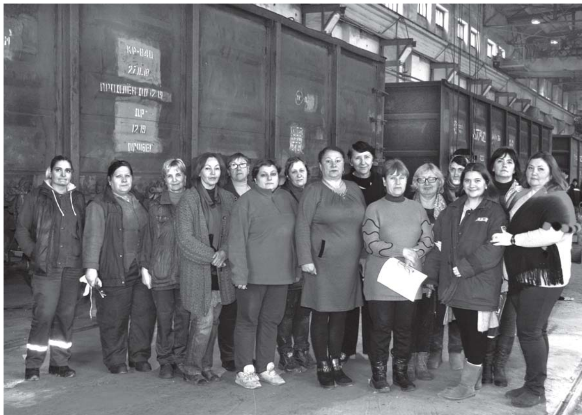
Женский коллектив вагонного депо Бельцы

В БЕЛЬЦКОМ ЛОКОМОТИВНОМ ДЕПО проще назвать, где не работают женщины, это только машинистами локомотива и их помощниками; заместителями по безопасности движения и эксплуатации; слеса-