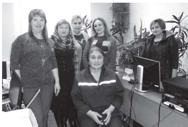
Милые, обаятельные — представительницы дистанции электроснабжения Бельцы