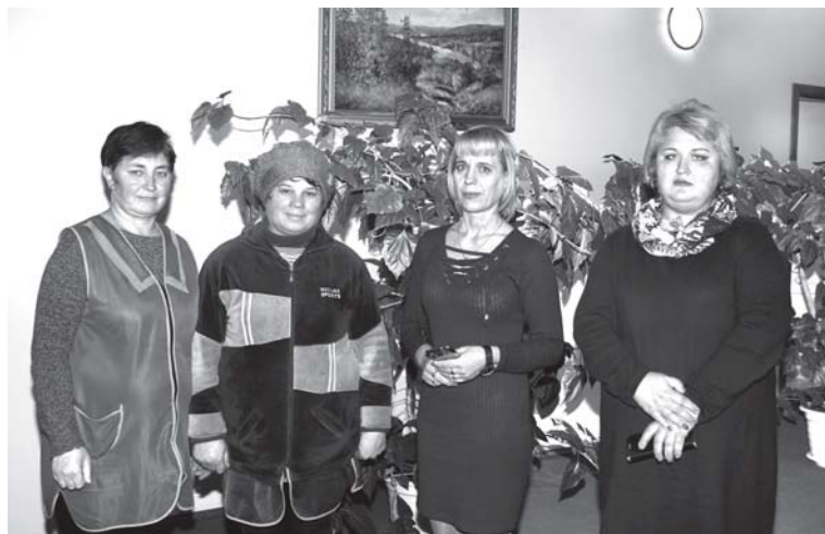
Движенцы ст.Бельцы-Слобозия — профессионалы в своем деле

Для представительниц слабого пола, работающих в БЕЛЬЦКОЙ ДИСТАНЦИИ ЭЛЕКТРОСНАБЖЕНИЯ , первое место в списке профессиональных ценностей занимает дисциплина. Но, как и любые женщины, они