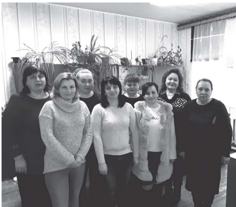
Женский коллектив Окницкой дистанции пути

Женщины на переезде работают по 12 часов в сутки наравне с мужчинами, порой удивляешься, как они справляются — и на работе, и дома, и при этом выглядят всегда очаровательно. Несмотря на то, что женщины трудятся наравне с мужчинами и все свои силы и знания отдают профессии, они еще и наш надежный тыл, так как умело сочетают работу с обязанностями