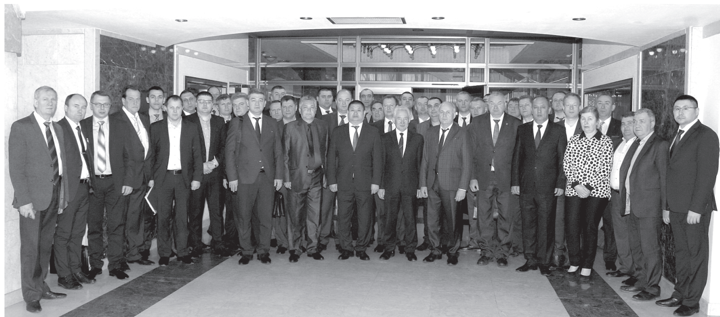
Традиционное фото участников совещания в Кишиневе