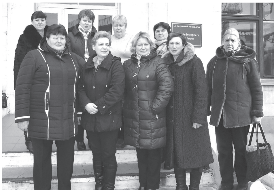
Самые опытные работницы ПЧ-1

Днем и ночью, в мороз и зной достойно несут свою трудовую вахту, обеспечивая безопасность движения поездов,