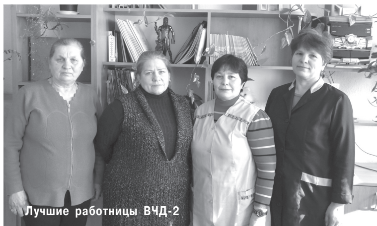
Лучшие работницы ВЧД-2

Поздравляю всех женщин нашего железнодорожного узла с Международным женским днем — 8 Марта! Желаю всем крепкого здоровья, счастья, удачи, благополучия и успехов в нашем не легком и ответственном труде.