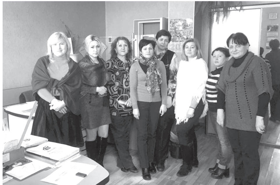
Работницы отдела кадров, ТО, секретариата, цеха питания ДОПа