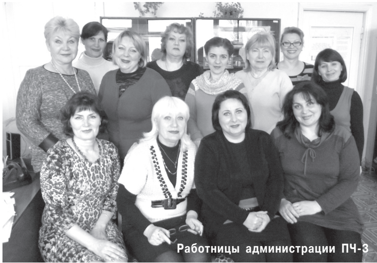
Работницы администрации ПЧ-3