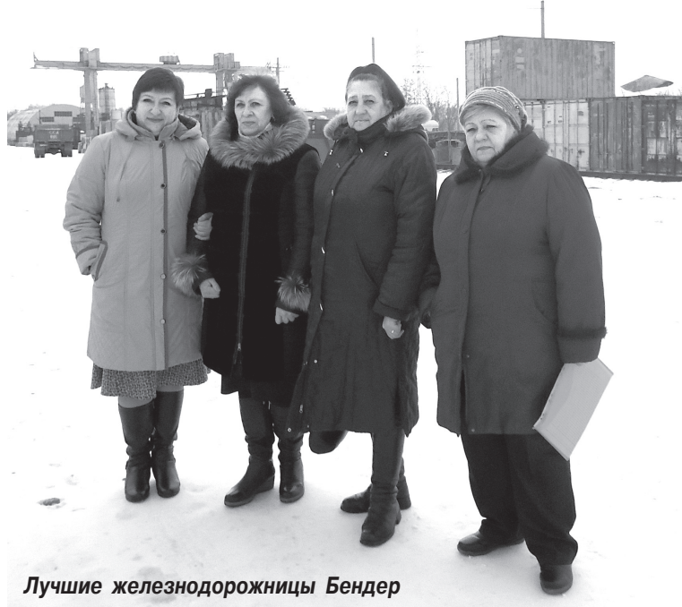
Лучшие железнодорожницы Бендер

Во всех филиалах железнодорожного узла ежедневно наши коллеги-женщины добросовестно выполняют свои должностные обязанности, успеш-