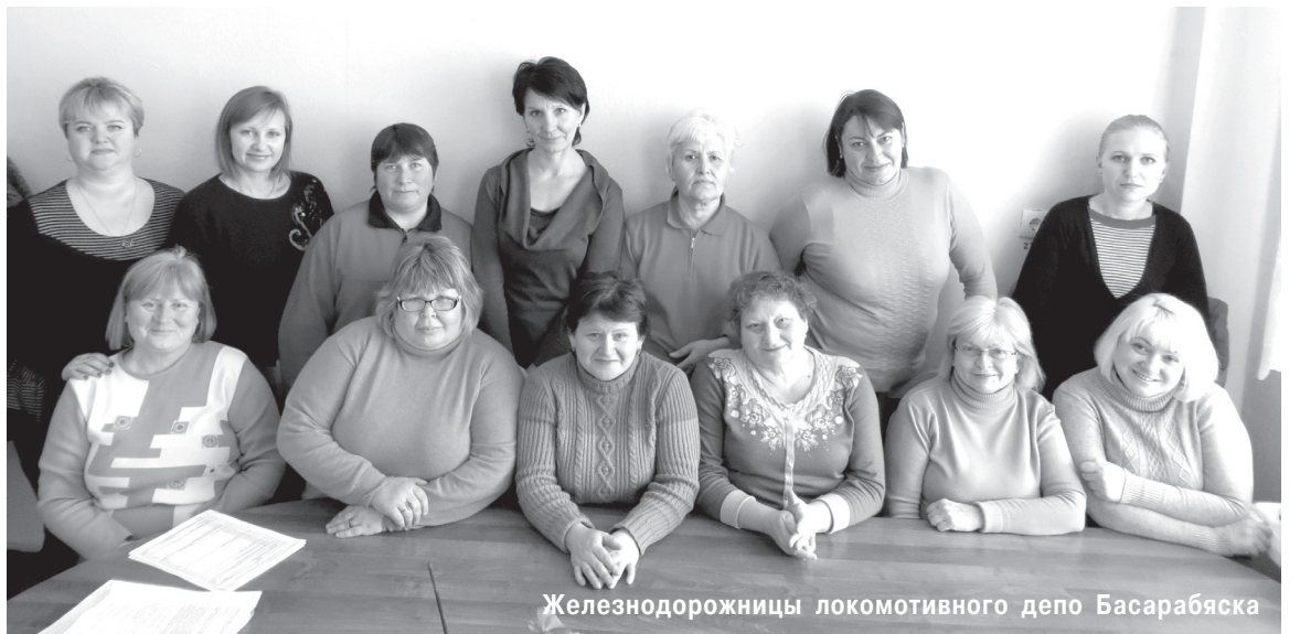
Железнодорожницы локомотивного депо Басарябьяска