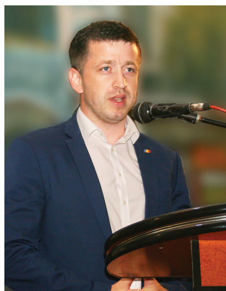
Сергей БУКАТАРУ, Председатель Административного совета CFM, вице-министр транспорта и дорожной инфраструктуры РМ