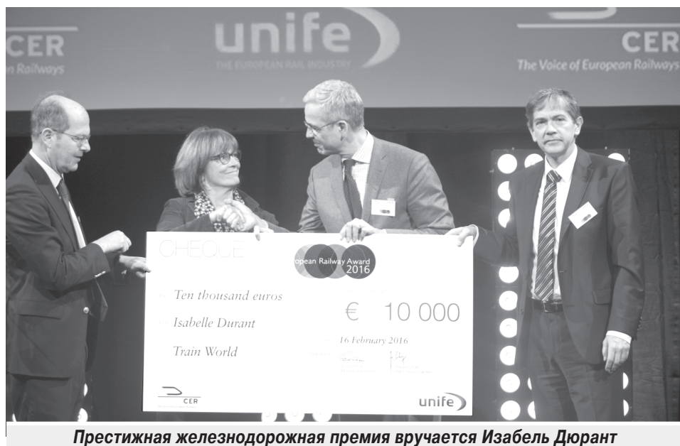
Престижная железнодорожная премия вручается Изабель Дюрант

Эта девятая церемония European Railway Award, начиная с 2007 года, когда европейский железнодорожный сектор начал чествовать выдающихся деятелей отрасли в знак признания их политических и технических заслуг в области железнодорожного транспорта. Церемония вручения наград состоялась в Королевском музее истории искусства Брюсселя (Musees Royaux D'Art et d'Histoire) в рамках совместного ежегодного приема CER–UNIFE, собравшего более 500 участников из всех стран Европы, включая высокопоставленных политиков и руководителей транспортной отрасли.