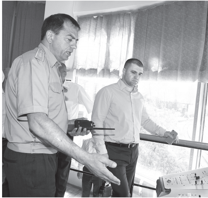
(Окончание. Начало на стр.1-3)

участках проделана действительно немалая работа по подготовке к летним перевозкам. Однако это не избавляет от дальнейшего поиска резервов.