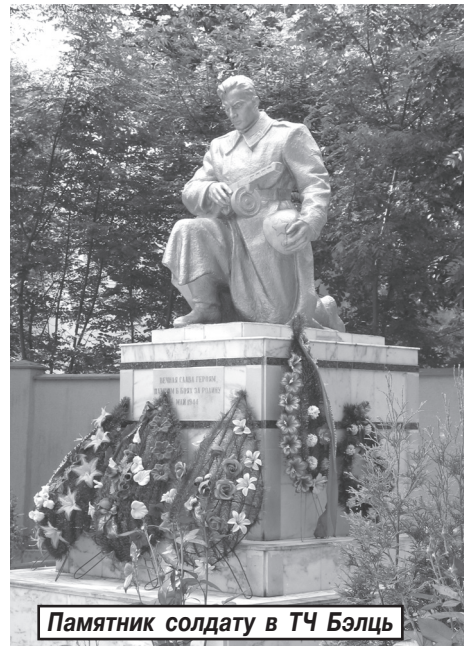
Памятник солдату в Т4 Бэлць

После освобождения в 1944 году нашего края от фашистской оккупации начался трудный этап восстановления