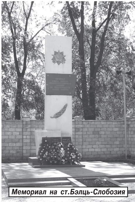
Мемориал на ст.Бэлць-Слобозия