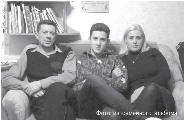
Фото из семейного альбома