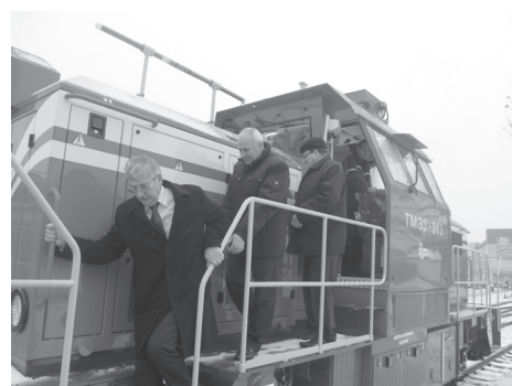
Модернизированный локомотив ТМЭЗ в депо Лида