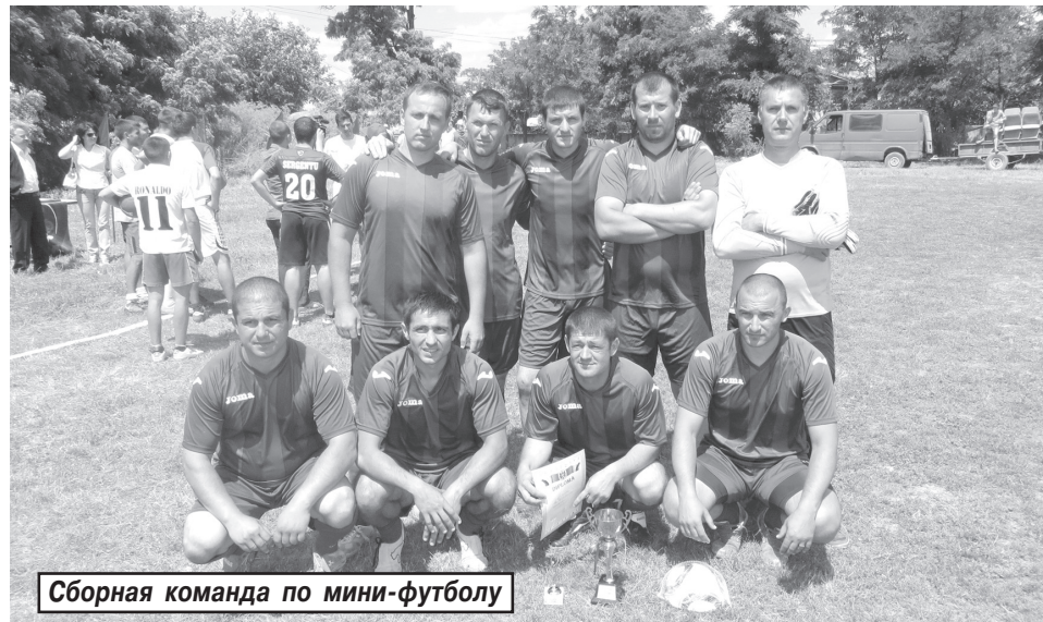
Сборная команда по мини-футболу