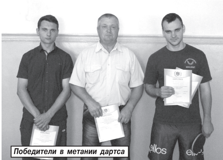
Победители в метании дартса