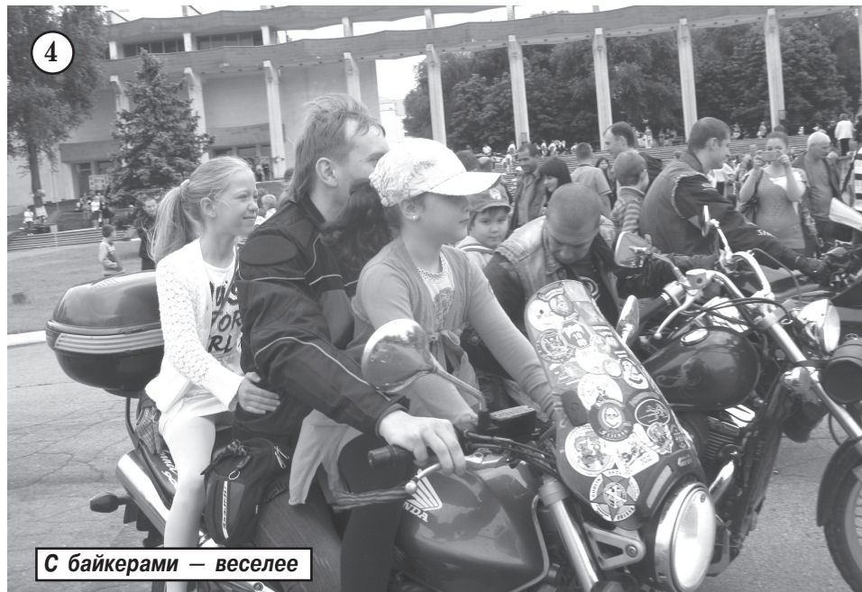
С байкерами — веселее

Ремонтируют качественно, экономят существенно