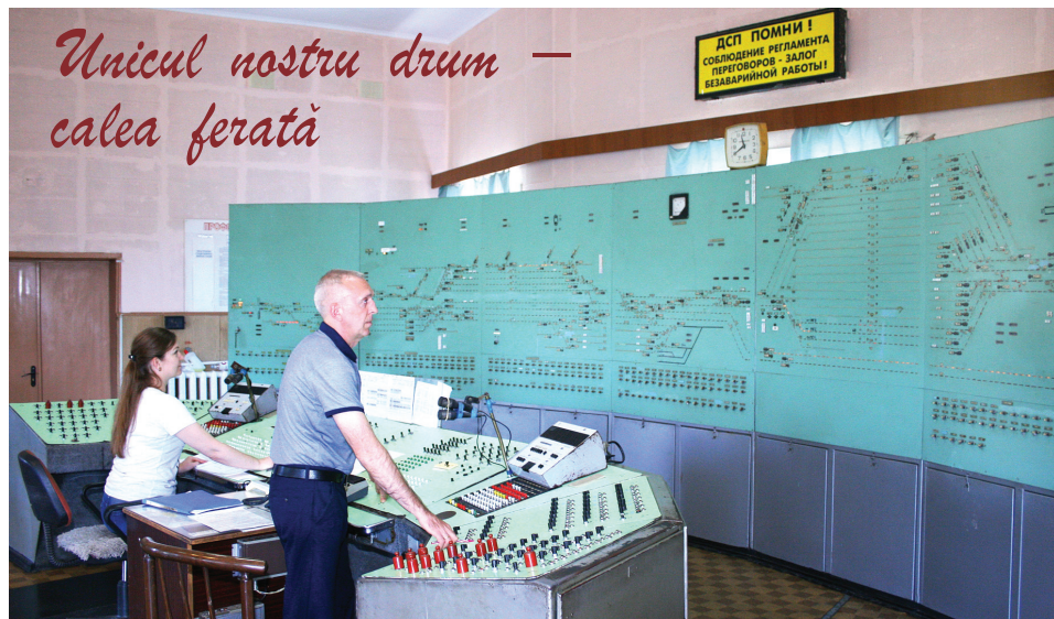
Unii vor marca sărbătoarea profesională în sânul familiei, dar cei mai mulți feroviar și în această zi vor remorca trenuri, vor deservi călătorii, agenții economici și vor avea grijă cu strictețe de securitatea circulației

Felicitări cu prilejul Zilei feroviarului, colegi!