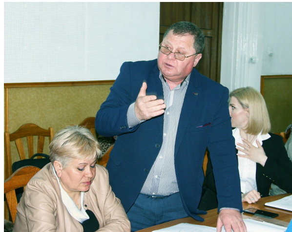
▲ Ion ZAPOROJAN, președinte al Federației sindicale a feroviarilor din Moldova