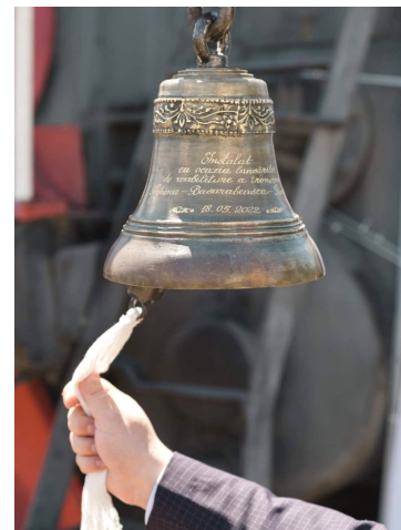
Clopotul memorabil instalat în Piața Gării

Calea Ferată a Moldovei — din nou în centrul atenției tuturor mass-media din republică și a cetățenilor