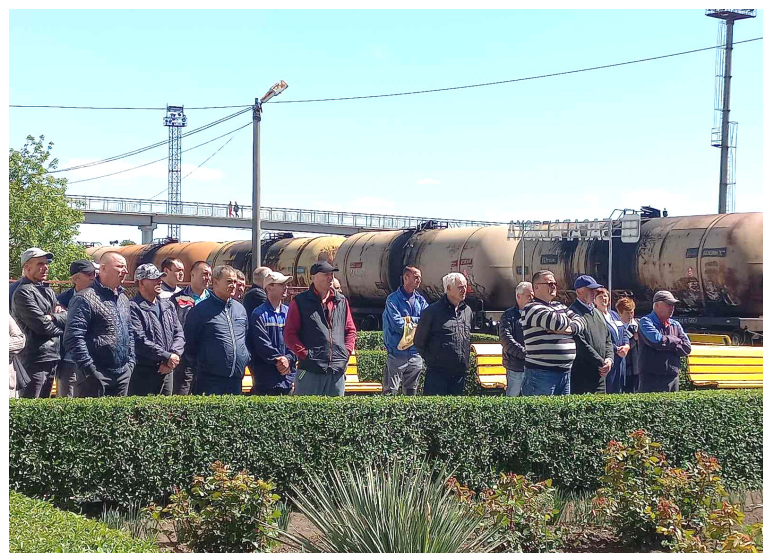
Realizarea proiectului este așteptată cu nerăbdare de feroviar, dar și de toată populația orașului Basarabeasca.

structură este de 113 mln euro, el devenind astfel cel mai mare în istoria Moldovei independente.