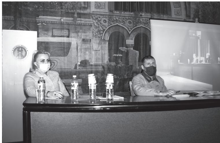
Sala mică a Palatului de cultură al feroviarilor – delegații congresului au urmărit pe un ecran instalat ceea ce se întâmplă în sala mare

de stat, dar nu beneficiază de bani din buget. Trebuie să înțeleagă fiecare, că putem conta doar pe ceea ce câștigăm, că toate beneficiile sociale pot fi