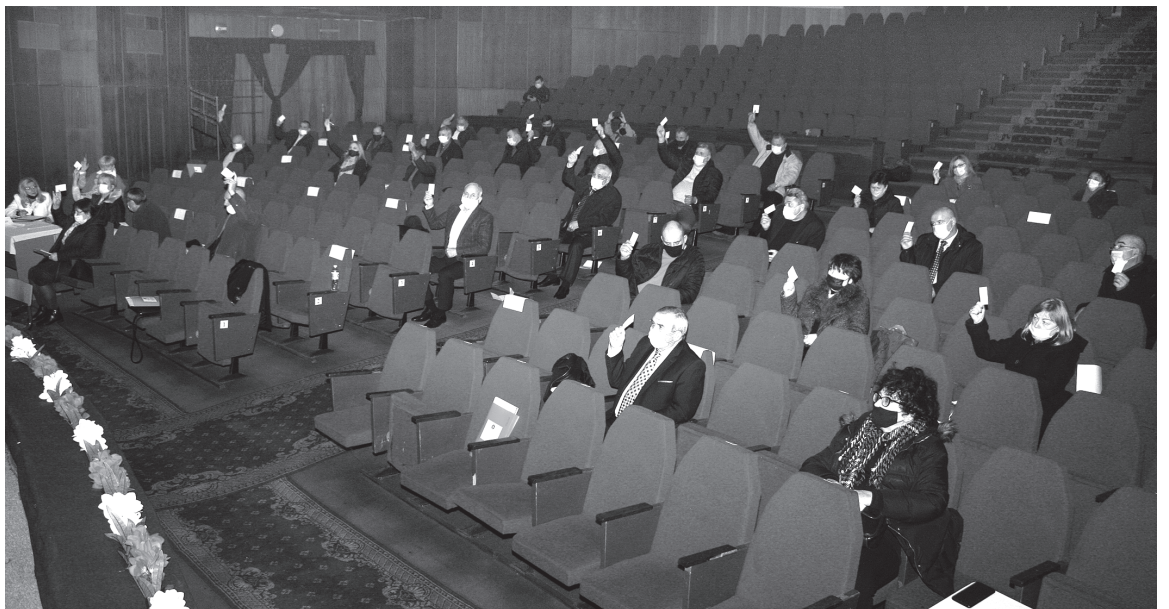
Prin majoritate de voturi au fost adoptate toate deciziile Congresului VI al Federației Sindicale a Feroviarilor din Moldova

De remarcat, că în cadrul controalelor Casa Națională de Asigurări Sociale și Confederația Națională a Sindicatelor din Moldova n-au depistat careva încălcări din partea Federației noastre.