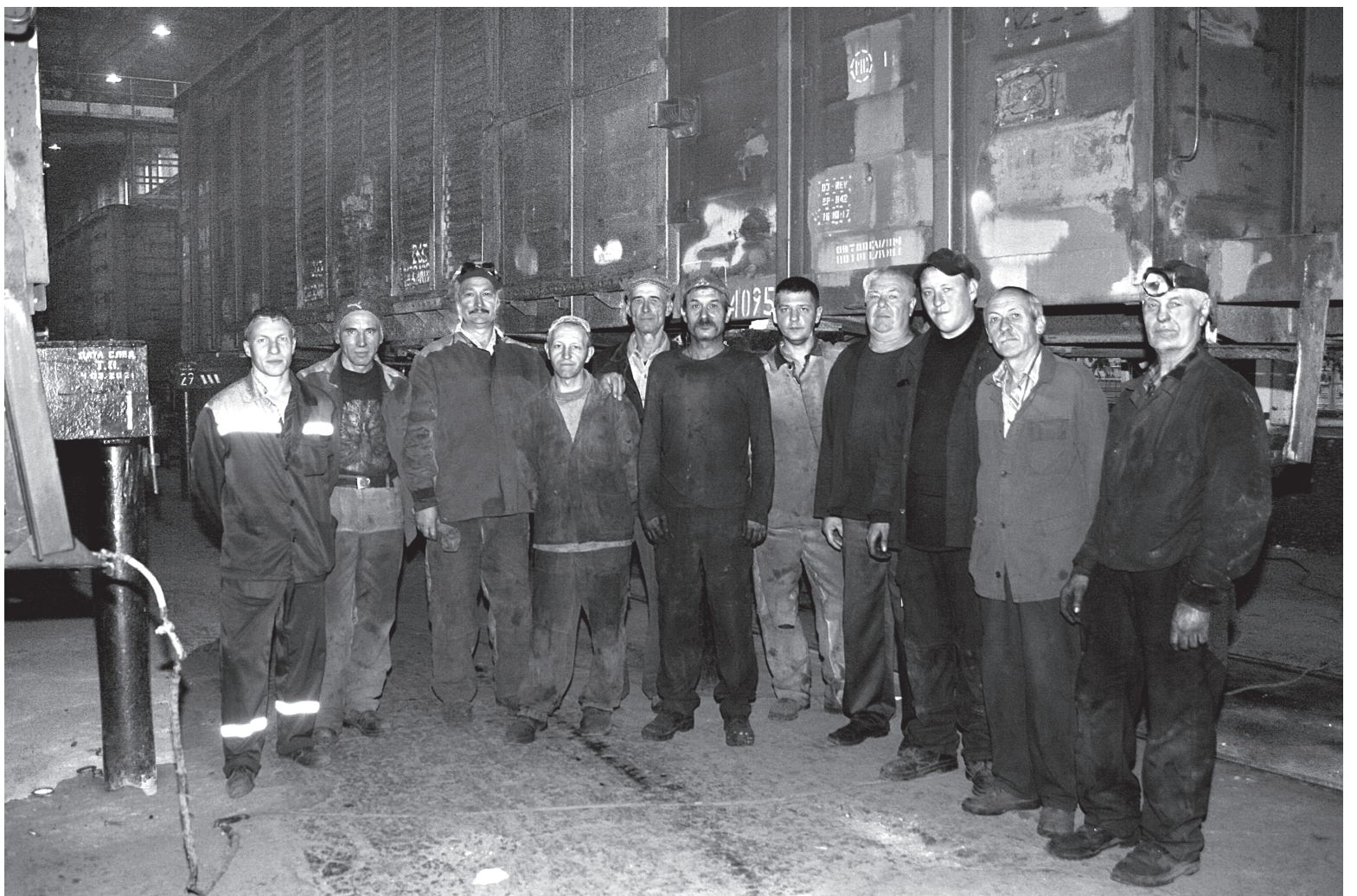
Un grup de lăcătuși ai sectorului asamblare a vagoanelor