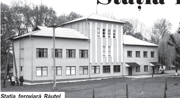
Stația feroviară Răuțel

Pentru a consolida situația financiară a CFM e necesar a atrage cât mai multe încărcături. În acest sens mai există încă multe posibilități nerealizate. O demonstrează, în particular, experiența colectivului stației Răuțel, care în ultimii ani a reușit nu doar să consolideze relațiile de afaceri cu agenții economici tradiționali, dar și să cointereseze alții noi pentru inițierea colaborării. În prezent feroviarul din partea locului oferă servicii de transport stabile unui număr de zece firme comerciale, dar și multor agenți ocazionali. Toate acestea contribuie, desigur, la îmbunătățirea traficului de marfă.