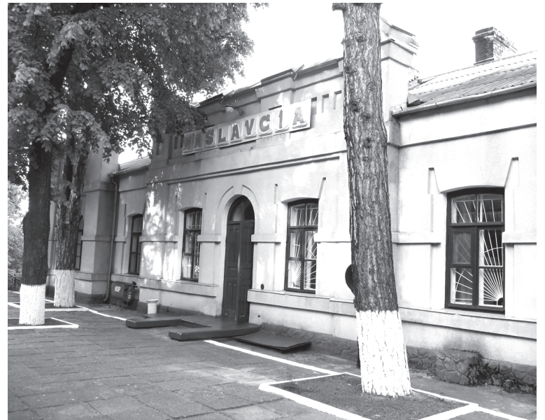
Stația feroviară Naslavcea