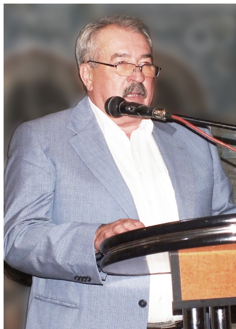
Mihai HÎNCU, vicepreședinte al Confederației Naționale a Sindicatelor din Republica Moldova