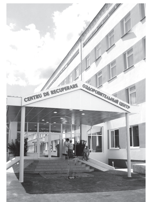
Centrul de recuperare al Magistralei moldovenești

Administrația căii ferate consideră medicina feroviară nu doar un domeniu social, ci parte importantă a procesului tehnologic de asigurare a securității circulației trenurilor. Anual pentru susținerea ei se cheltuie peste 39 milioane lei, dintre care 15 milioane provin din veniturile pentru serviciile oferite contra plată și mijloacele Companiei naționale de asigurări, iar 21