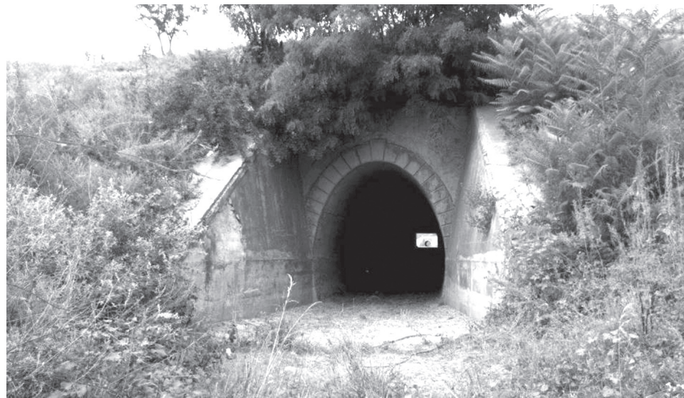
Tunelul, construit de specialiștii români în anul 1931

datorează capacității de atunci a locomotivelor cu abur, care din cauza forței de tracțiune reduse nu puteau depăși colinele înalte. Se știe că tunelul a fost proiectat în Marea Britanie, iar lucrările de construcție au fost supravegheate de ingineri englezi. Martorii povestesc, că "procesul de muncă era unul neobișnuit. O echipă săpa dintr-o parte, alta — din partea opusă. Și s-au întâlnit cu exactitate de un centimetru".