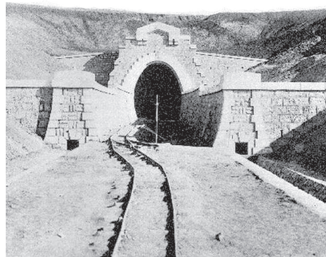
Pe timpuri aici clocotea munca, circulau trenuri

Atunci, când se construia calea ferată, Dobruja era un mic sătuc cu case de lut, acoperite cu stuf. Linia de cale ferată avea importanță strategică, fiind construită de un batalion român de geniști. Însă cele mai grele lucrări le îndeplineau dobrojienii: cărau pietre, împingeau cărucioarele cu pământ.