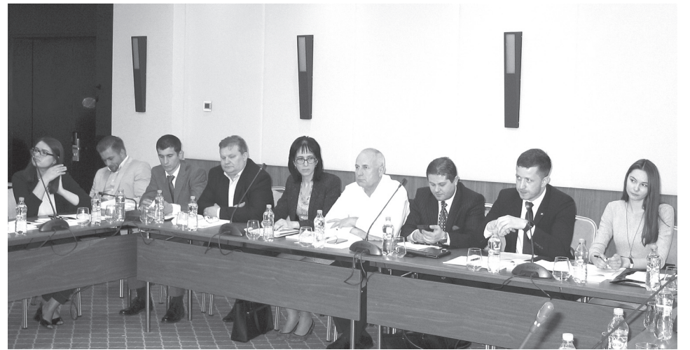
Un instantaneu de la atelierul de lucru

În baza materialelor serviciului de presă al IS "CFM"