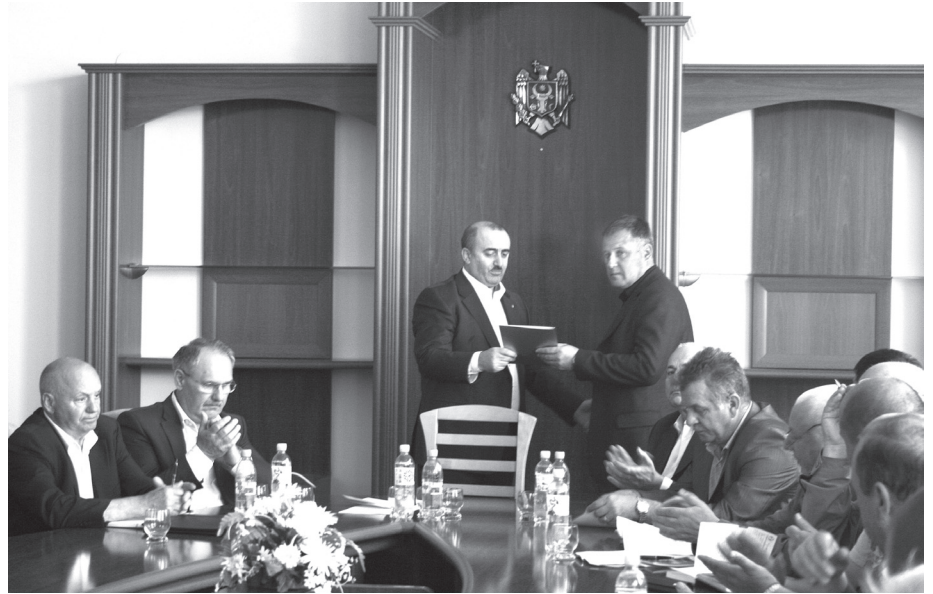
Momentul înmănării distincției