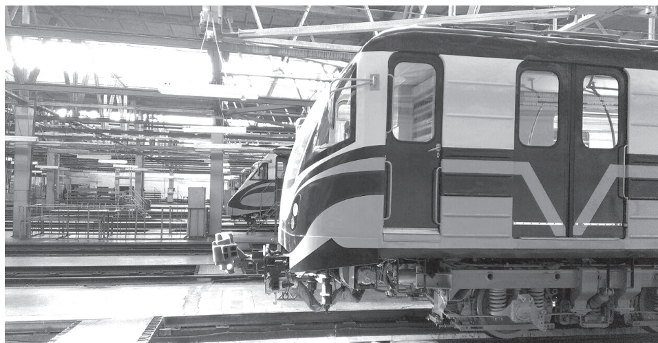
Uzina de construcție și reparație a vagoanelor de pasageri din Tașkent

NOTĂ: La ora actuală în transportul feroviar al Uzbekistanului muncesc peste 70 mii de angajați. Dezvoltarea transportului în această țară, situată la intersecția căilor dintre Vest și Est, a fost întotdeauna un obiectiv prioritar. Transportul feroviar ocupă în mod stabil poziția de lider în traficul intern și internațional al Uzbekistanului.