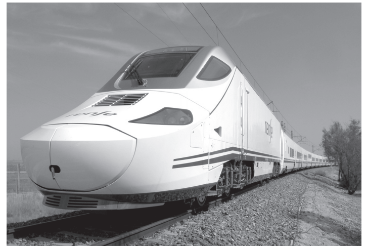
Pasagerii ÎS «CFM» și SA «Uzbekiston temir iullari» sunt uniți de posibilitatea de a călători în confort