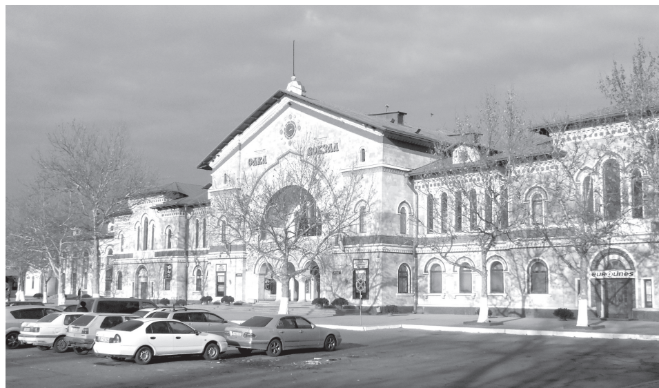
Fiodor NEGRU, șef al nodului feroviar Basarabeasca: