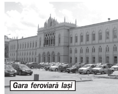
Gara feroviară Iași

NOTĂ INFORMATIVĂ: Iași este al doilea oraș ca populație din România după București. Orașul este destul de vechi, fiind întemeiat încă în secolul XV. Aici există numeroase locuri și monumente remarcabile interesante. La fel ca și Roma, Iași se întind pe șapte coline. Fiecare colină are o biserică, de pe clopotnița cărora se deschid vederi impresionante.