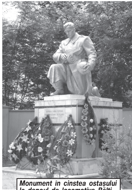
Monument in cinstea ostașului la depoul de locomotive Bălți

În anul 1944, după eliberarea ținutului de sub ocupația fascistă a început perioada dificilă a refacerii infrastructurii feroviare distruse. Fiecare zi de muncă era plină