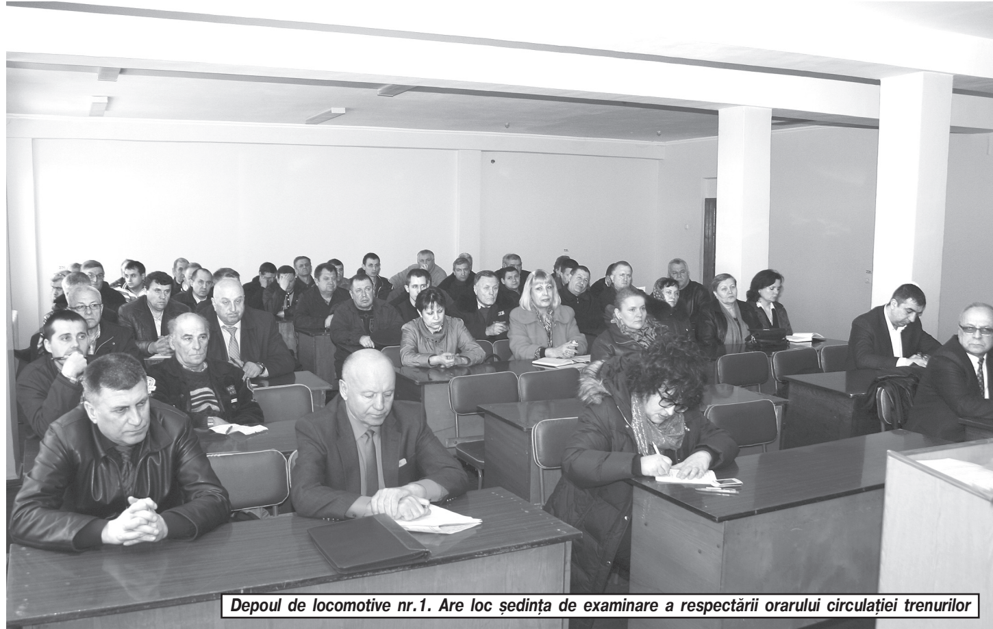
Depoul de locomotive nr.1. Are loc ședința de examinare a respectării orarului circulației trenurilor