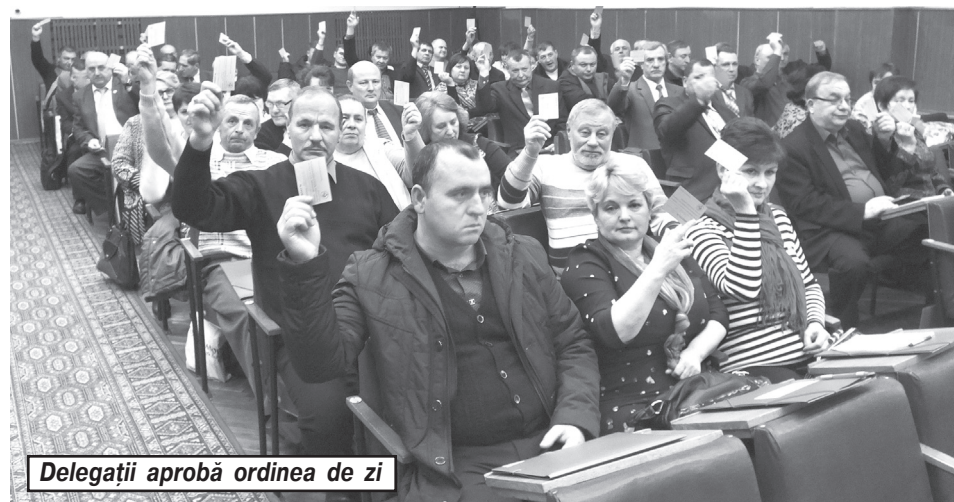
Delegații aprobă ordinea de zi

Comisia de control și revizie a efectuat la toate nodurile feroviare controale privind corectitudinea evidenței, distribuirii și eliberării biletelor de tratament. Rezultatele lor au fost examinate la ședințele prezidiului Consiliului. Președinții comitetelor sindicale au fost atenționați asupra