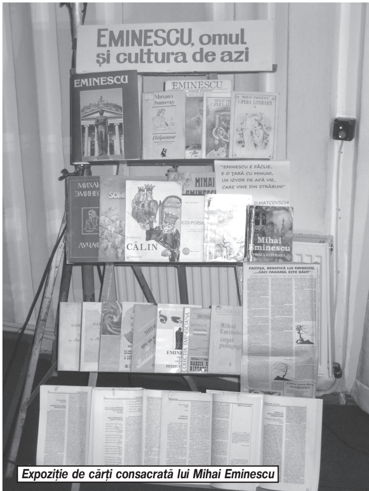
Expoziție de cărți consacrată lui Mihai Eminescu