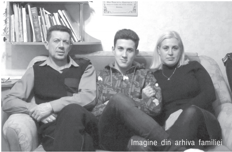
Imagine din arhiva familiei