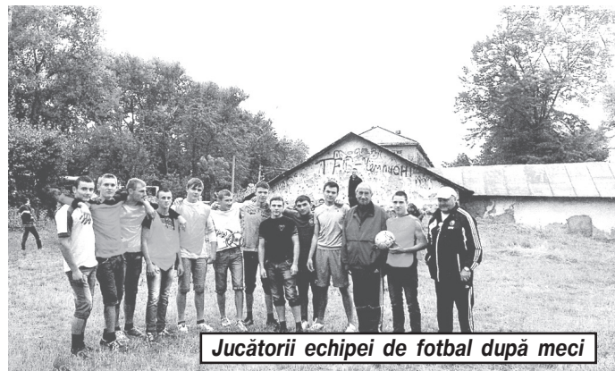
Jucătorii echipei de fotbal după meci

O dată cu începerea noului an de studii, la Colegiul tehnic feroviar din Bălți a demarat o nouă spartachiadă, cea de-a 14-a. Au participat studenți din toți cei patru ani de studii.