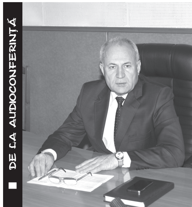
DE LA AUDIOCONFERINȚĂ

Predarea fluxului de marfă a fost în medie zilnic 268 de vagoane în locul celor 265 planificate, adică s-au predat zilnic cu 3 vagoane mai mult.