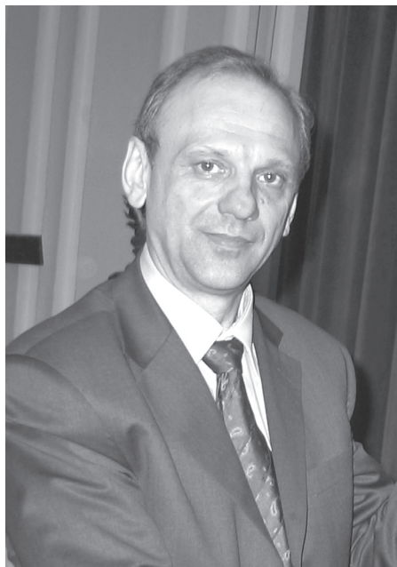
Ghenadii KOSOLAPOV, secretar general al Confederației internationale a sindicatelor feroviarilor (CISF) și constructorilor feroviar