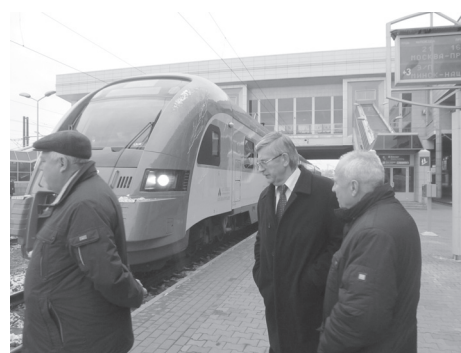
Trenul diesel DP3 — o producție a «PESA Bydgoszcz» SA