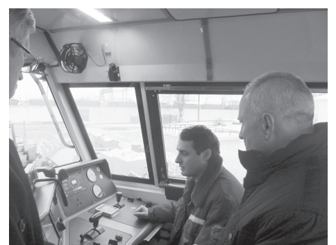
Un mecanic de locomotivă demonstrează o dirijare logică a locomotivei TM33