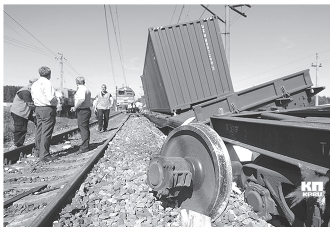
Catastrofă feroviară în regiunea Moskovei

Însoțitorilor de vagon li s-a alăturat și electricianul trenului. Din echipă fac parte două femei. Împreună cu angajații din vagonul-restaurant însoțitorii de vagon au primit ordinul să asigure răniții cu apă potabilă. Formind două grupuri, membrii echipei au început să scoată oamenii de sub dărâmturi. Unii transmiteau de sus,