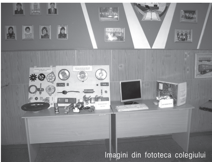
Imagini din fototeca colegiului

nități le oferă colegiul după absolvirea instituției de învățământ.