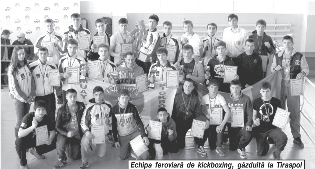
Echipa feroviară de kickboxing, găzduită la Tiraspol