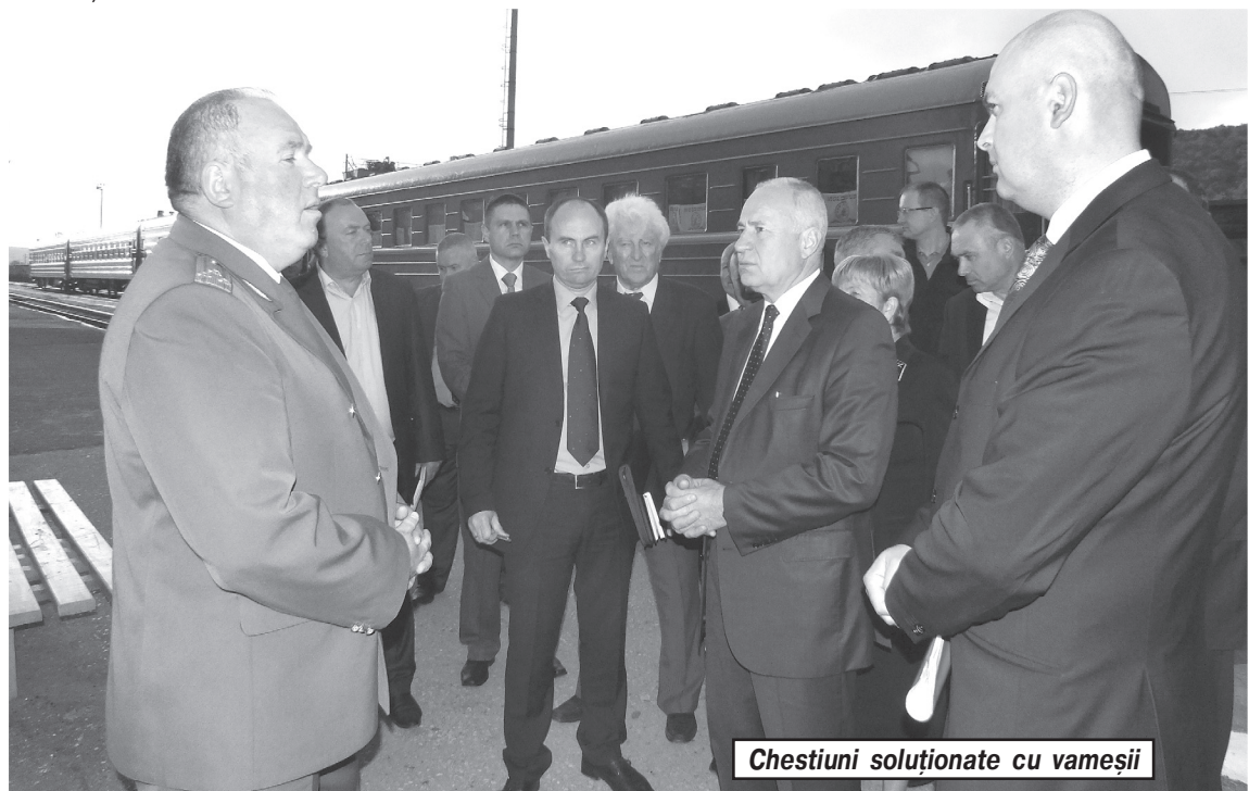
Chestiuni soluționate cu vameșii

condiții complicate a început revizia de primăvară.