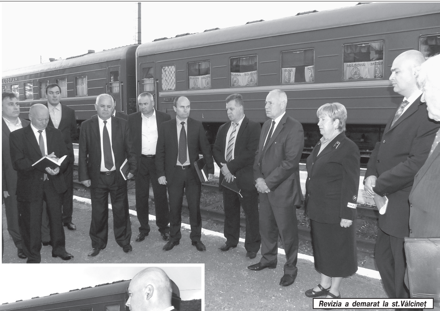
Revizia a demarat la st. Vălcineț

M agistrala moldovenească începe sezonul de vară împovărată de mari probleme, acumulate de-a lungul anilor. Continuă să trezească neliniște starea stocurilor învechite de locomotive și vagoane, gospodăria liniei, barem multe altele. Or, pentru renovarea lor conform exigențelor actuale lipsesc catastrofal mijloacele necesare. De aceea e firesc ca atîta timp, cit în procesul de reformare ce se derulează nu vor fi create noi posibilități de dezvoltare și modernizare cu suportul structurilor financiare internaționale, nu se poate întreprinde nimic altceva decît a căuta cu și mai multă insistență rezerve interne. În asemenea