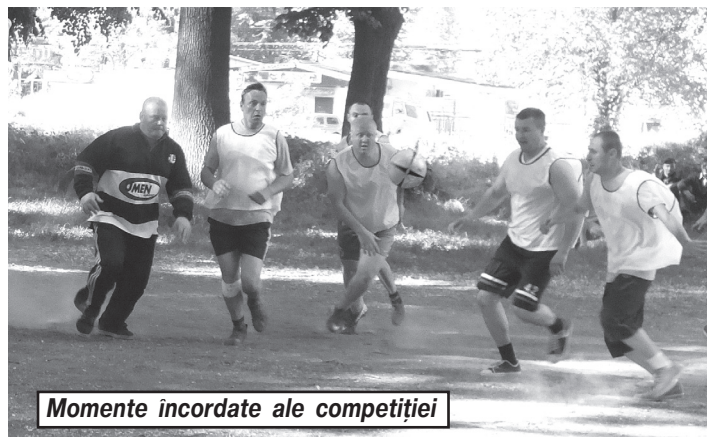
Momente incordate ale competiției