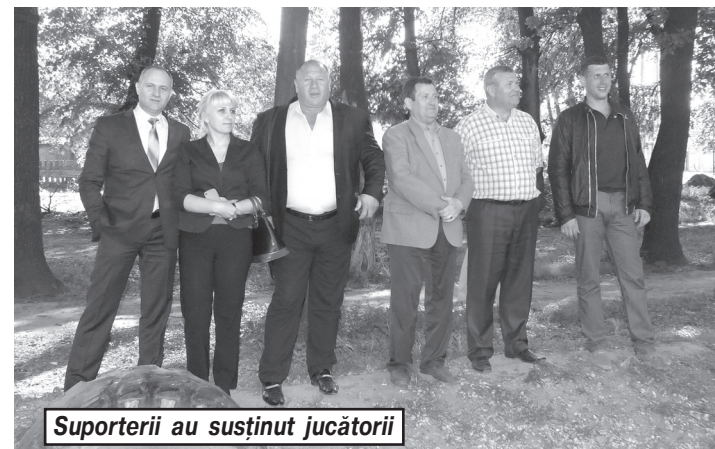
Suporterii au susținut jucătorii