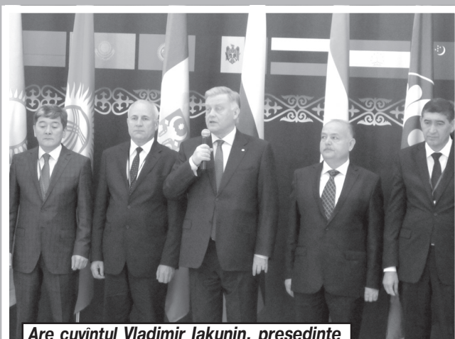
Are cuvintul Vladimir Iakunin, președinte al Consiliului, președinte al SAD «RJD»