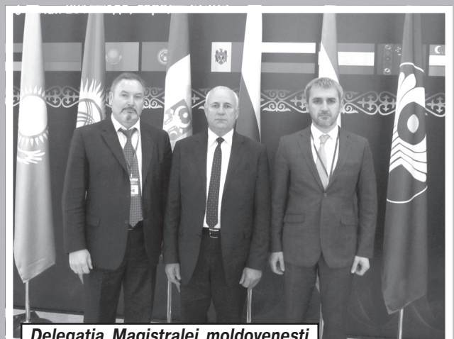
Delegația Magistralei moldovenești