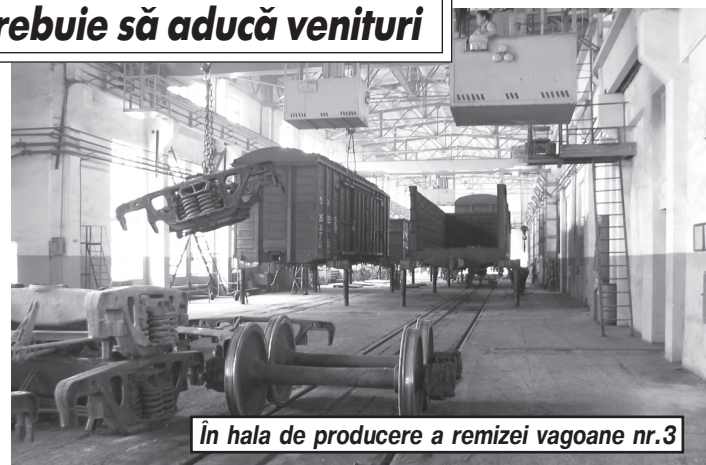
În hala de producere a remizei vagoane nr.3

Succesul realizat nu constituie o limită a posibilităților. Existența rezervelor ne-