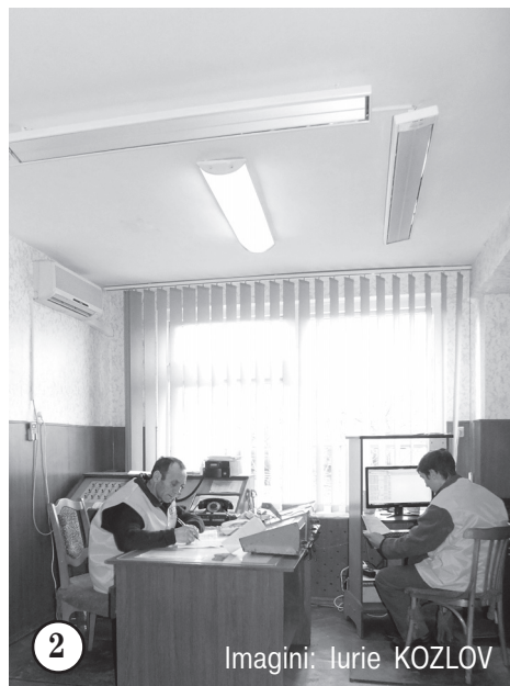
Imagini: Iurie KOZLOV