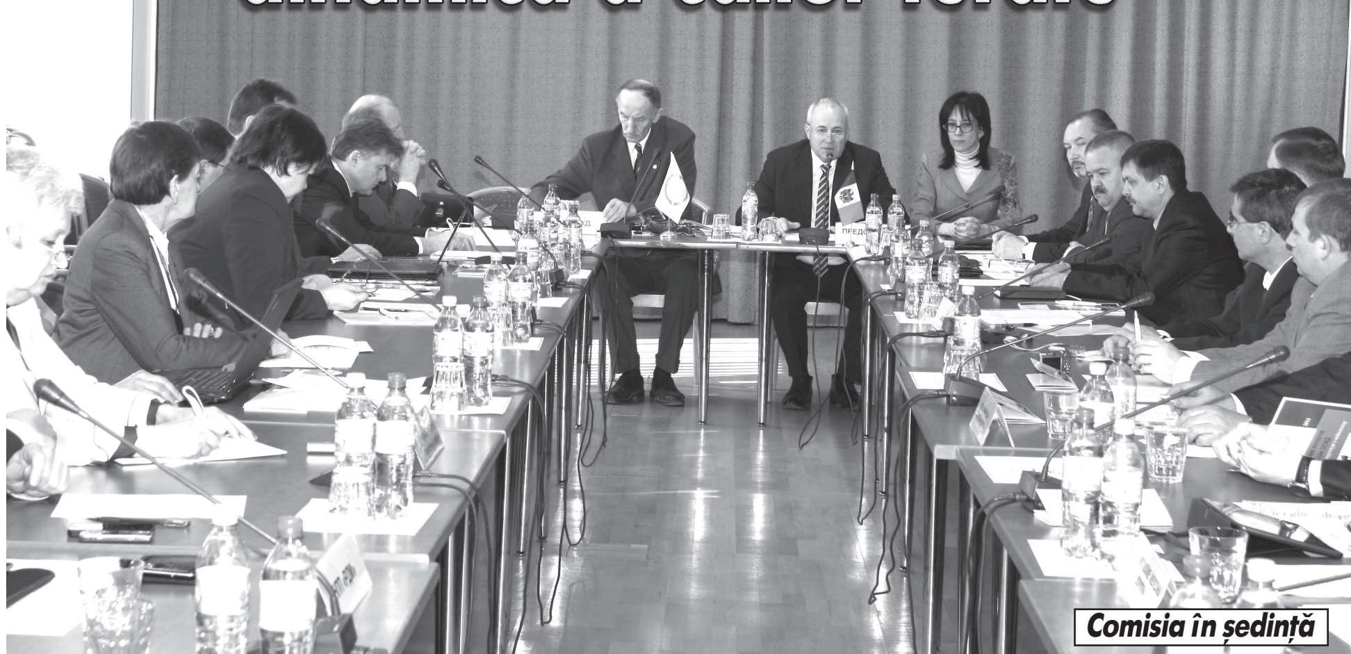
Comisia în ședință